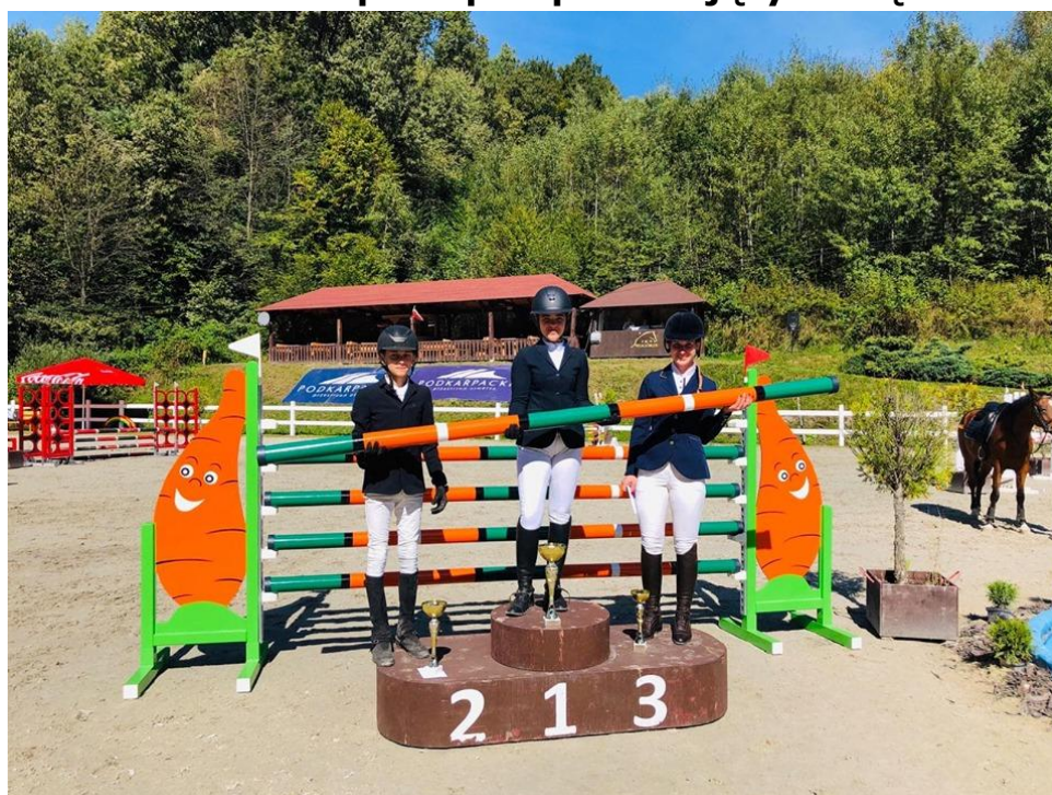
Zwycięzcy Grand Prix Amatorów 2020